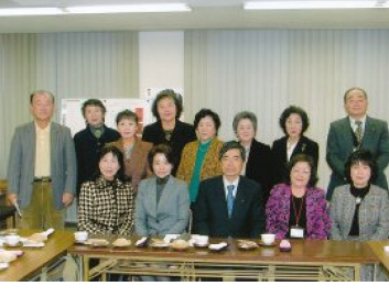
呉事務所にて集会