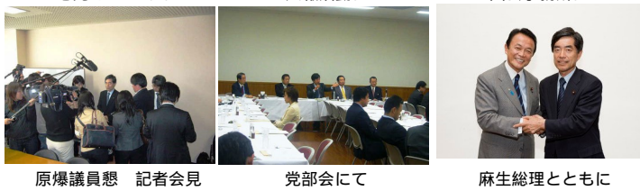
原爆議員懇 記者会見