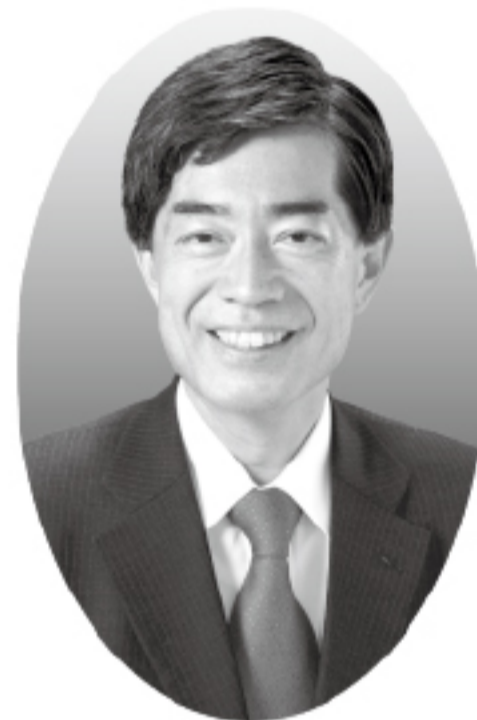
内閣府副大臣 復興副大臣 衆議院議員