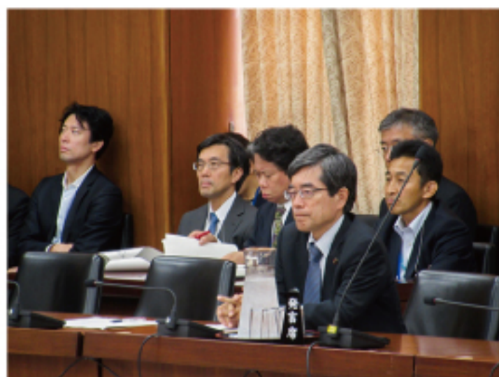
▲地方創生特別委員会