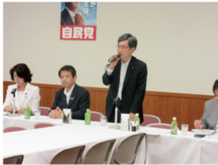
▲地域活性化議員連盟 会長を仰仕りました。