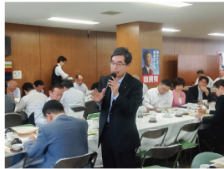
▲地方創生関係会議 地方創生の重要性を訴えました。