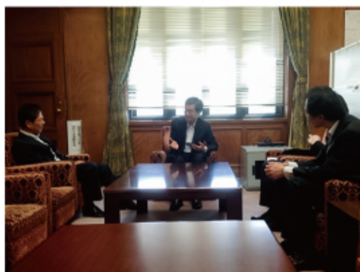
▲金融庁メンバーとの意見交換 郵貯限度額問題など申し入れました。