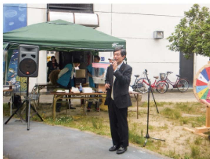
▲地元商店街イベント