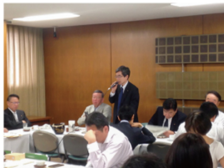
▲党本部にて政策会議