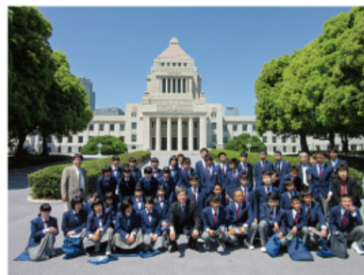
▲地元中学生国会見学案内