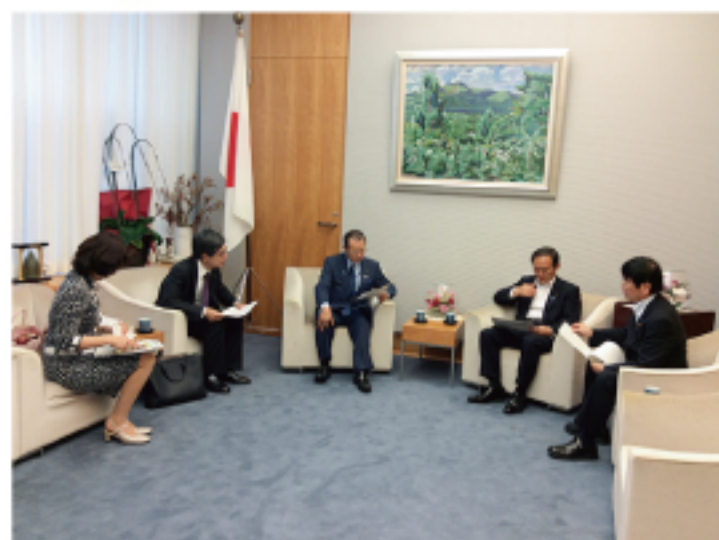
▲官邸にて菅官房長官へ申入れ