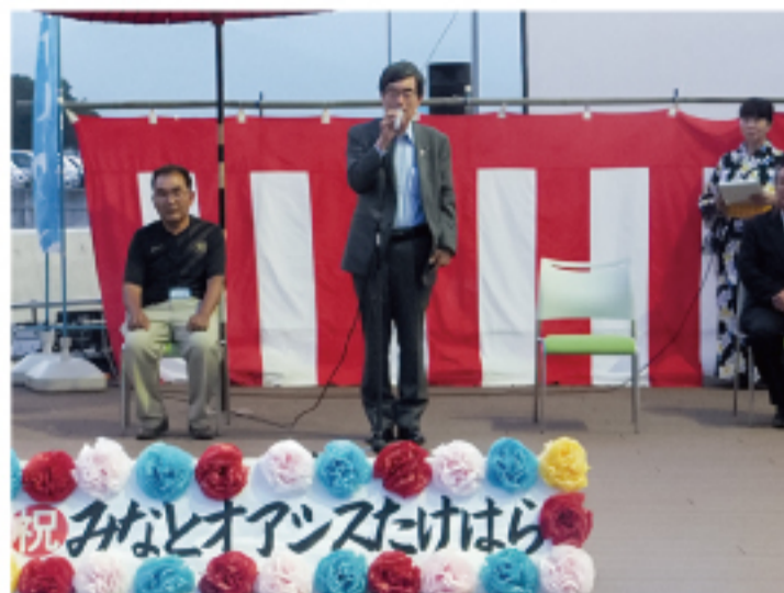
▲みなとオアシスたけはら