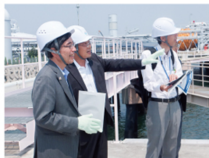
▲広島港湾視察 防災護岸工事を視察しました。