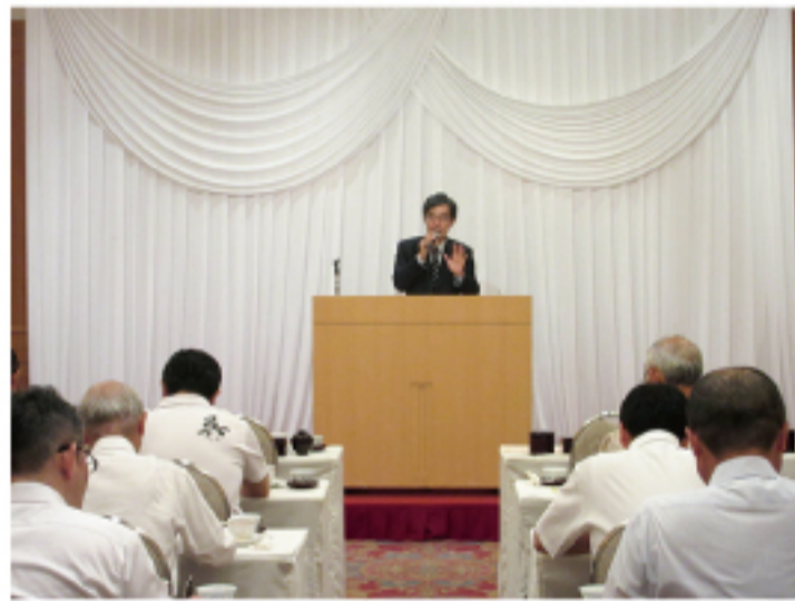
▲モーニングセミナー 地元含め多くの方々に来て頂きました。