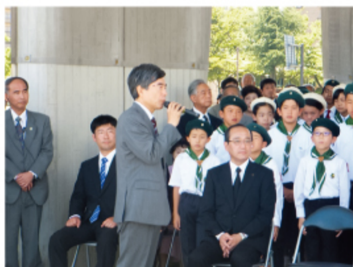
▲原爆死没者追悼式 原爆死没者に哀悼の誠を捧げました。